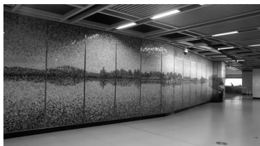
图6 武汉地铁岳家嘴站艺术墙

武汉地铁4号线岳家嘴站毗邻风景秀丽的国家5A级景区“东湖风景区”。该站以武汉东湖八景为创作基础,创作了“东湖掠影”艺术主题墙面,采用16色青花瓷片作为主要材料,将瓷片拼贴镶嵌于画面。青花瓷使画面效果雅致清新,很好地将东湖的个性及深层内涵表达出来,既吻合“绿色出行”这一主题,又具有人文关怀之意(如图6所示)。