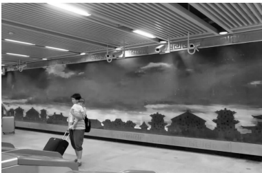
图 1 武汉地铁武昌火车站站艺术墙 Fig. 1 Wuhan Metro Wuchang Railway Station art wall

军工等 4 个方面,展现武汉在中国近代史上的第一次腾飞。武汉地铁 4 号线仁和路站公共艺术墙的“光辉岁月”壁画,突出了工业元素,采用现实的表现手法,融入了 1934 年武昌造船厂、1953 年武汉重型机床厂、1954 年武汉锅炉厂和 1955 年武汉钢铁厂这 4 幅代表武汉工业发展的历史篇章,展现了武汉工业文明的历史变化和武汉钢铁工业的历史变迁,突显了武汉作为重工业城市的历史地位。