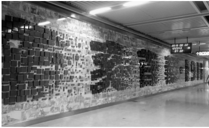
图 3 武汉地铁首义路站艺术墙 Fig. 3 Wuhan Metro Shouyi Road Station art wall

现代革命文化类:武汉是武昌起义之地,也是辛亥革命的开端之地。武汉地铁 4 号线首义路站文化墙上用大小不等、形态各异的红砖,错落有致地拼凑组合出“辛亥首义·1911”几个鲜红大字(如图 3 所示),并与背景墙上 1 500 幅手绘历史人物图片和起义场景相辅相成。这种蒙太奇的创新艺术手法,给人以强烈的视觉冲击力,更使人牢记革命传统和革命精神。