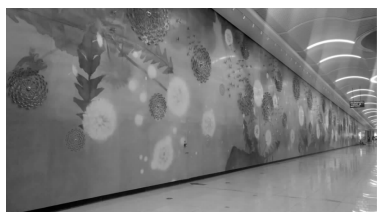
图5 武汉地铁珞雄路站艺术墙

段的新增站点,其周边商业空间及高校众多,散发着年轻人的朝气与活力。该站以“霓流花韵”为设计主题,来表现百花齐放的商业氛围。站内设计了柔和舒适的LED光源、五彩星空图案的穹顶、五彩斑斓的蝴蝶造型装饰,意趣十足。站内艺术墙设计主题为《飞翔》,以蒲公英为设计元素进行创造,寓意着在青年的时候充满着朝气,成熟后放飞自己的梦想,去追求理想,彰显出浪漫情怀感(如图5所示)。