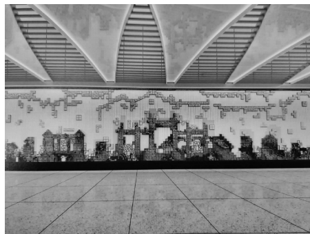
图2 苏州地铁4号线察院场站壁画

重构法则作为文化符号背后人文精神与现代设计相结合的基础,具体手法有变形、隐喻、夸张、错位、多元叙述主体、跨文化重构等,其核心要义就是让传统与现代融合,让传统符号与现代精神融为一体。例如苏州地铁4号线察院场站壁画《苏式彩韵》(见图2),一个个彩色方块象征深具历史底蕴的苏州商业文化元素在察院场周边沉淀,色块不仅