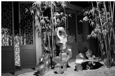
图5 苏州地铁2号线火车站站的《园林意象》

上津桥、下津桥“桥上桥”的空灵审美意象,再配以渔船、驳岸,呈现出古色古香的江南水乡风貌。