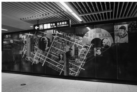
图7 苏州地铁1号线乐桥站艺术墙

1) 设计说明。该壁画设置在地铁1号线乐桥站(见图7),重点突出吴文化崇文重教、经世致用、儒雅风流的文化性格与价值观念,古今乐桥区域都坐落着历史悠久的书院、学校,苏州人自古崇文重教,诗文之风浓郁;文化性格具体表现在典雅自然、精巧秀慧衬托其秀外慧中、心灵手巧的精神个性,勤奋好学、与时俱进衬托其自觉学习、领悟时代的精神,言利务实、内敛自适衬托其精明求利、自适自足的文化性格。整个壁画以南宋苏州《平江图》和苏州画家水乡题材抽象水彩画为背景,把苏州教育先贤的形与言镶嵌在千年格局未变的地图之上,开辟了我国地铁壁画中专门介绍地方教育事业的先河。