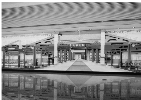
图9 苏州地铁4号线北寺塔站艺术墙

1) 设计说明。该作品设置在地铁4号线北寺塔站(见图9),重点突出吴文化宗教信仰元素。苏州人不但信奉佛教还信奉道教,现存有报恩寺、云岩寺、寒山寺、玄妙观等众多庙宇、道观。该作品以北寺塔底建筑结构作为主要元素,以视觉中心“知恩报恩”四字点题,解构北寺塔内建筑结构,通过空间推进的构成方式,再现塔内建筑结构的整体面貌。背景处理上以北寺塔建塔典故“孙权报母恩”为主题,运用壁画的表现手法,深具吴文化历史底蕴的同时兼具时尚气息。