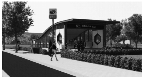
图 4 苏州地铁 5 号线游客集散中心站出入口

中心站出入口(见图 4),建筑前半部分仍以园林白墙漏窗为主元素,屋顶色彩为仿古黛色,前段采用大坡度单坡深檐,后檐坡度弧线向下慢收回翘,整个屋顶线条极具传统意味。这种运用新材料、新工艺的创新设计方法,使地铁出入口在保留吴文化传统意趣的同时又不失现代感 [3] 。