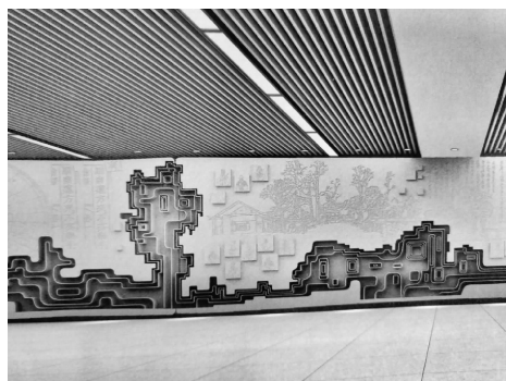
图1 苏州地铁4号线南门站壁画

地域文化符号的提取运用需要借助抽象化法则,即使用最为概括的符号语言反映事物的本质特征。原有文化实体是具象形态的,难以让人展开联想并产生更为深刻的文化意境,而通过抽象化法则建立设计符号系统,可以将泛化的文化概念转化为一种可以代表这一地域文化,具有强烈识别性的设计语言。如苏州地铁4号线南门站壁画《天地仁贤》(见图1),通过抽象的水纹线条幻化为苏州园林中最具特色的太湖石造型,以此展现吴地水乡古城“水、石、城”之间的关联与情怀,彰显苏州人杰地灵的地域文化特征。