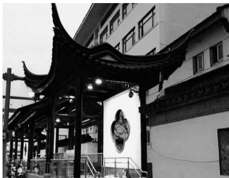
图 3 苏州地铁 4 号线三元坊出入口

第一,出入口建筑文化元素与周边环境相协调。老城区地铁出入口建筑传承苏州传统园林建筑外观及架构方式,对保持苏州古城风貌,使乘客快速识别起着非常重要的作用。如地铁 4 号线三元坊站出入口外观为古色古香的园林建筑形式(见图 3),其由三座高低相错的双坡屋顶直廊和两座歇山四方亭组成,背衬墙垣,点缀漏窗,粉墙黛瓦,朱漆廊柱和挂落,俨然一派江南新园林意象,与古城风貌高度契合。