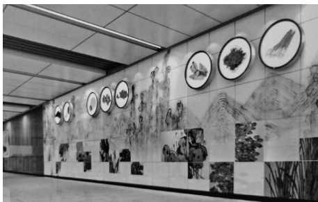
图8 苏州地铁2号线尹山湖站艺术墙

1) 设计说明。该作品设置在地铁2号线尹山湖站(见图8),重点突出吴文化的饮食文化元素。苏州自然环境优越、物产丰富,水稻种植、茶业种植、水产业、家禽家畜养殖、渔业捕捞等产业发达,这为饮食文化的发展夯实了物质基础,再结合吴地苏州人的审美情趣、生活方式、烹饪文化,使得苏州饮食文化独具一格。具体饮食文化元素有“水八仙”、阳澄湖大闸蟹、四腮鲈鱼等。尹中路站位于苏州东南郊区郭巷镇,地势低洼,湖田较多,适合水生蔬菜种植。春时荸荠夏时藕,秋时茭菇冬时芹,三到十月有茭白,水生四季有蔬菜。该作品以“水八仙”为主题,底层运用新吴门水墨写意的艺术形式,将红菱、莲藕、茭实等“水八仙”元素放置于清秀的湖光山色之上,整体画面用釉上彩瓷板画为材料,内置灯箱施以“水八仙”画面,作品淡雅素净、人文气息浓郁,与站内装修色彩和谐统一 [4] 。